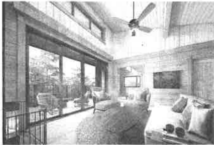
西武HDは東急不の一部販売を受託する(西武が軽井沢で建設中の「ヴィラ」のイメージ図)

西武HDは17年、傘下参入した。「プリンス・のプリンスホテルを通バケーション・クラブ」じ、会員制ホテル事業にの名称で全国約20カ所に